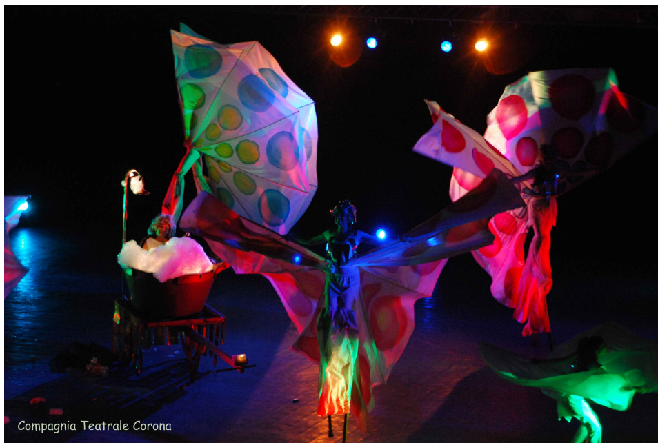
Compagnia Teatrale Corona