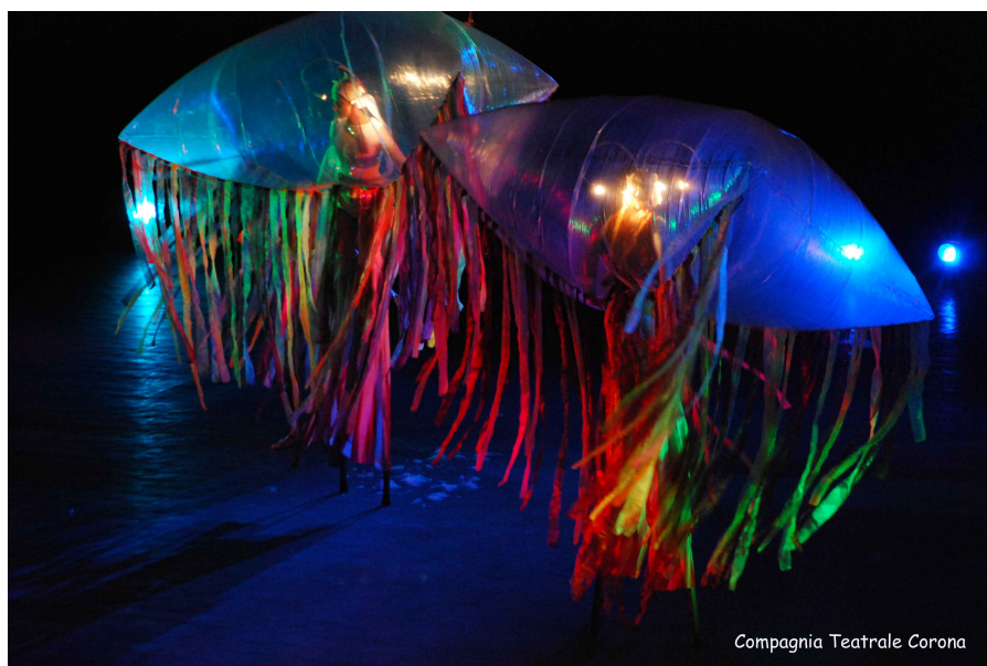
Compagnia Teatrale Corona

Un uomo anziano esce dalla sua vasca da bagno piena di schiuma e come un bambino si guarda stupito in giro. Il mondo intorno gli fa paura, monaci l'illuminano, una fata lo ringiovanisce e gli fa crescere lunghi capelli con un incantesimo. Sembra che la vita del vecchio ricominci da capo, amore e violenza entrano con impeto. Ma alla fine tutto è transitorietà..